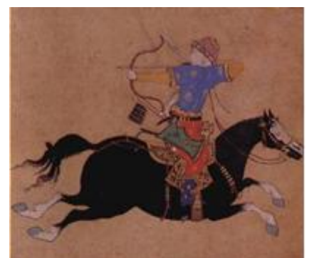
מימין, פרש ערבי מול אביר צלבני