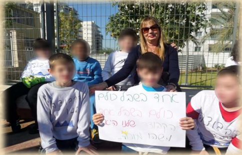
פתיחת טורניר כדורגל