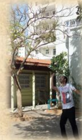
ביקור סטודנטים מצטיינים - מכון וינגייט