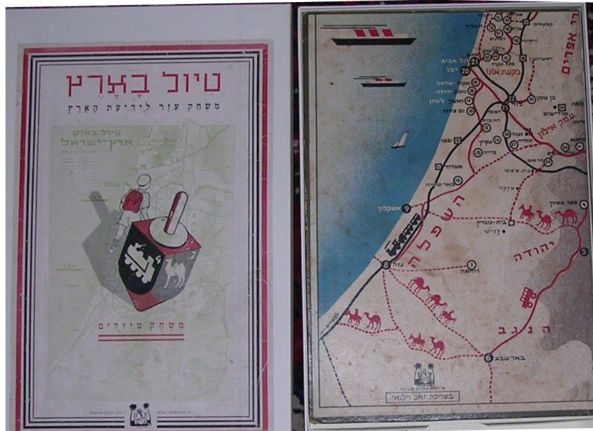
טיול בארץ 1936