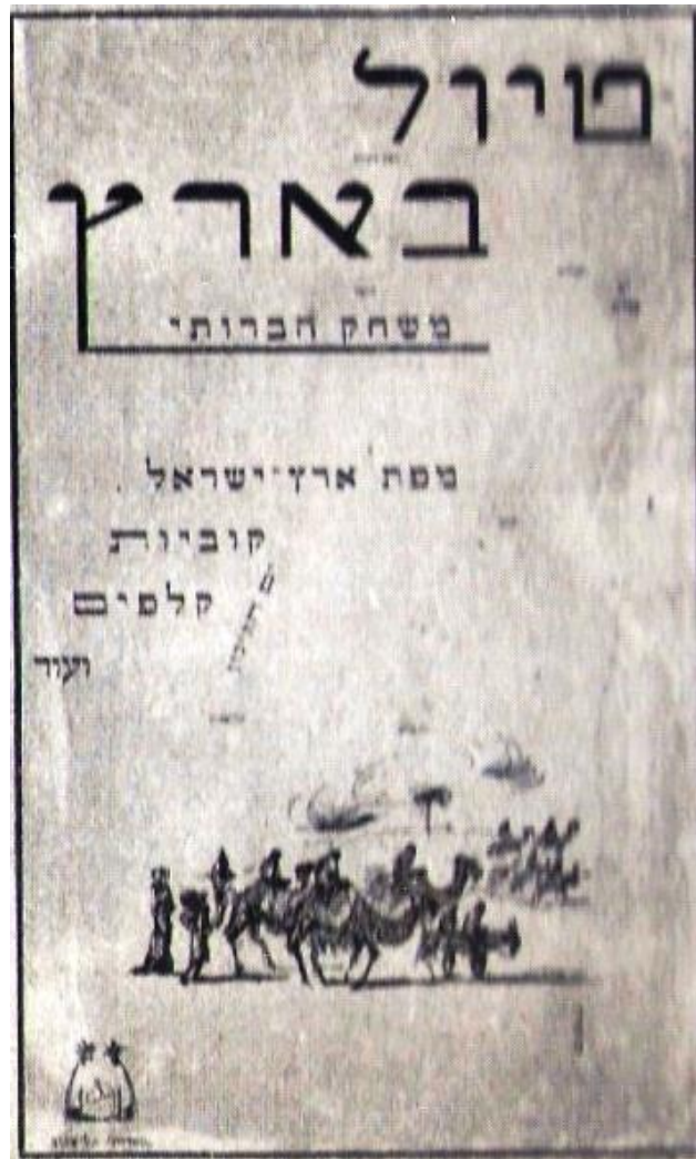
טיול בארץ 1926

בשנת 1926 הוציא ברלוי, מלך המשחקים של פעם, את גרסתו הראשונה למשחק "טיול בארץ", זה היה המשחק הראשון שהוא ייצר בא". ברלוי הגדיר עצמו כ"הוצאת משחקים עממיים, חינוכיים וספרי ילדים". הוצאת משחק במסגרת הוצאת ספרים הייתה מקובלת באותם ימים. על מכסה קופסת המשחק משנת 26 נראית שיירה של הולכים הכוללת זוג חמורים ומחמוריהם, גמלים ורוכביהם, ואנשים הנעים במרחבים פתוחים על גבי מפת א", מפת המשחק ו"מורה דרך למשחק". במשחק יכולים לשחק יותר משנים, מטרתם בלוי בחברת אחרים תוך הכרת היישובים על מפת הארץ.